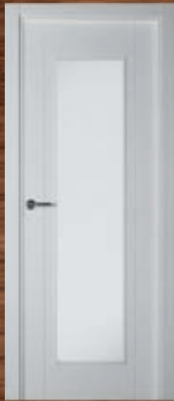
LAC 218 V