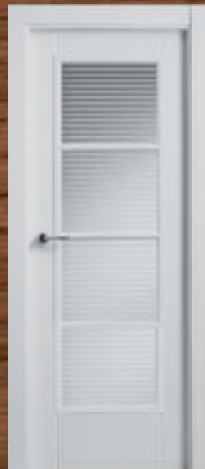
LAC 221 4V