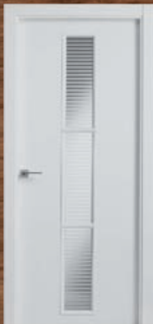
LAC 227 3V