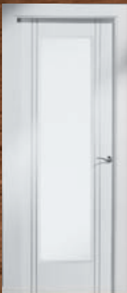
LAC 245 V