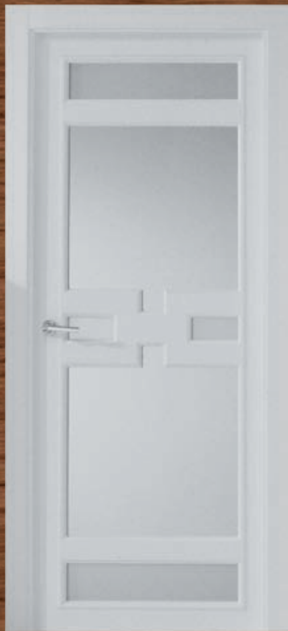
LAC 235 V