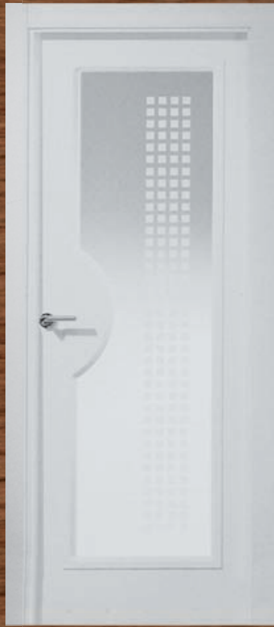
LAC 24I V