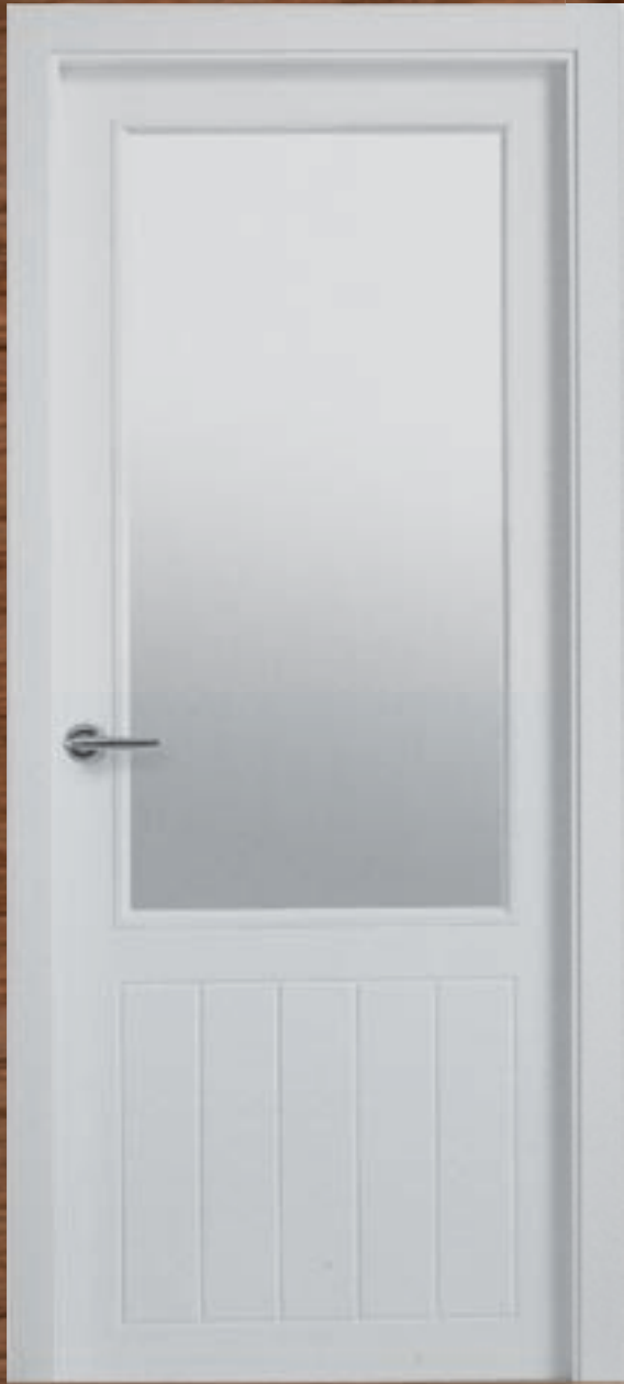
LAC 215 V