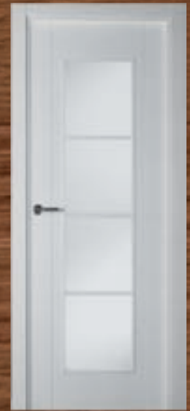
LAC 218 4V