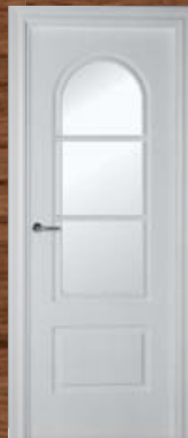
LAC 205 3V