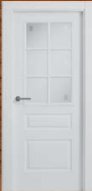
LAC 206 6V