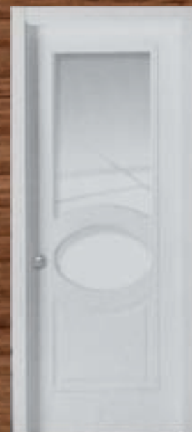
LAC 214 2V