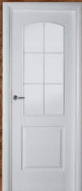
LAC 213 6V