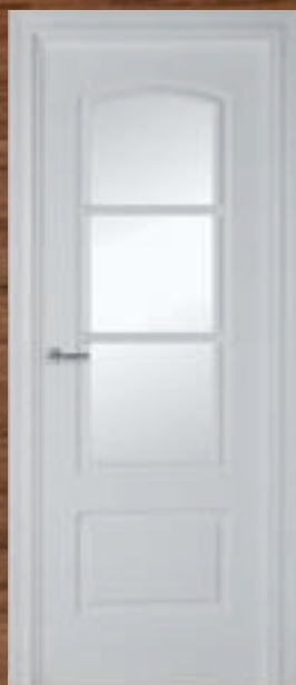
LAC 204 3V