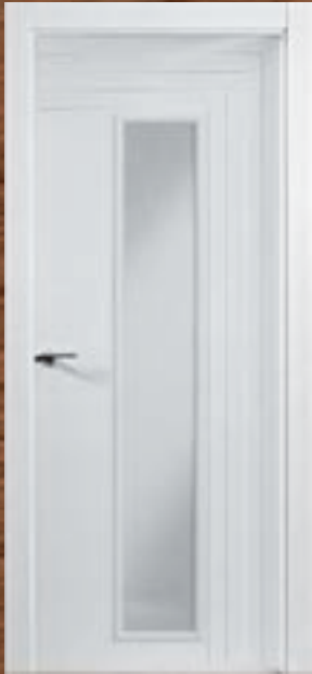
LAC 223 V