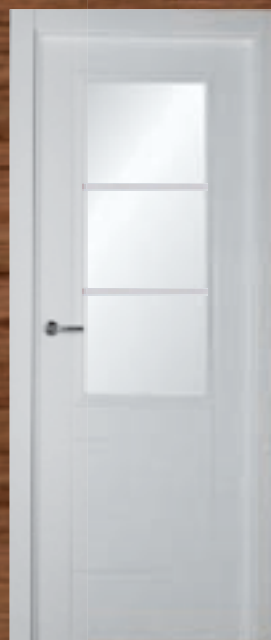
LAC 219 3V