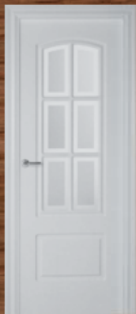
LAC 204 6V