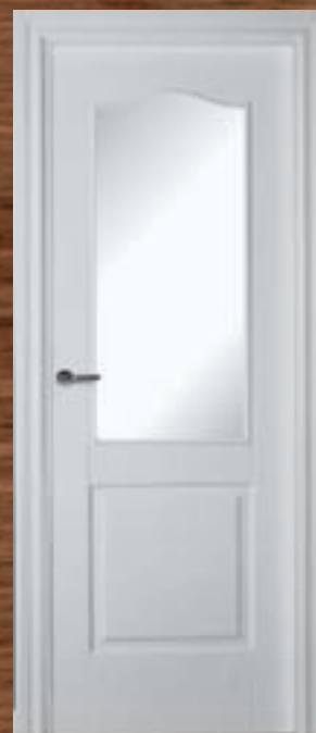
LAC 212 V