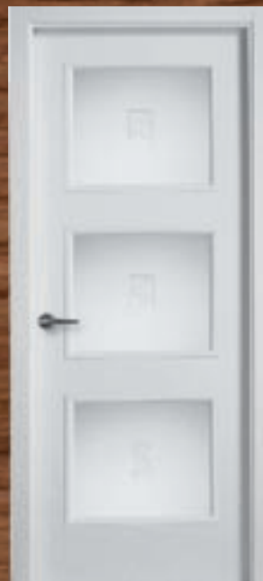
LAC 240 3V