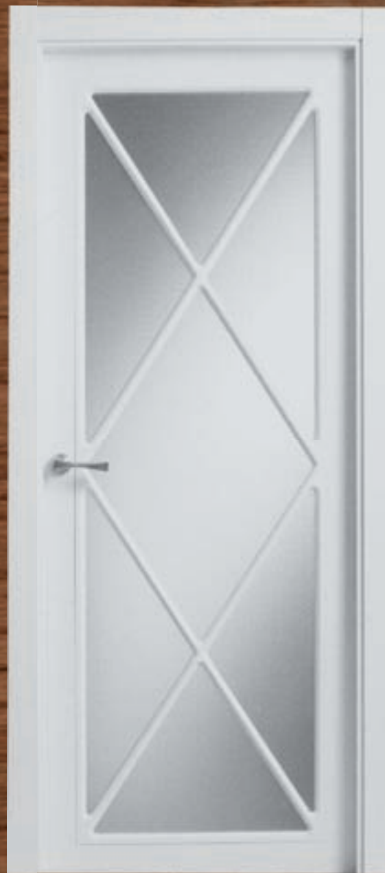
LAC 236 V