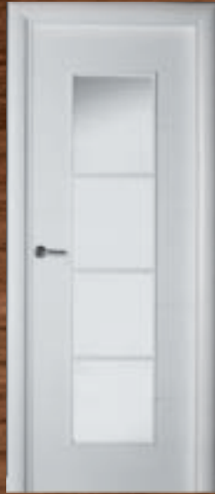
LAC 220 4V