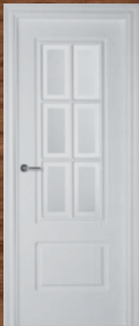
LAC 202 6V