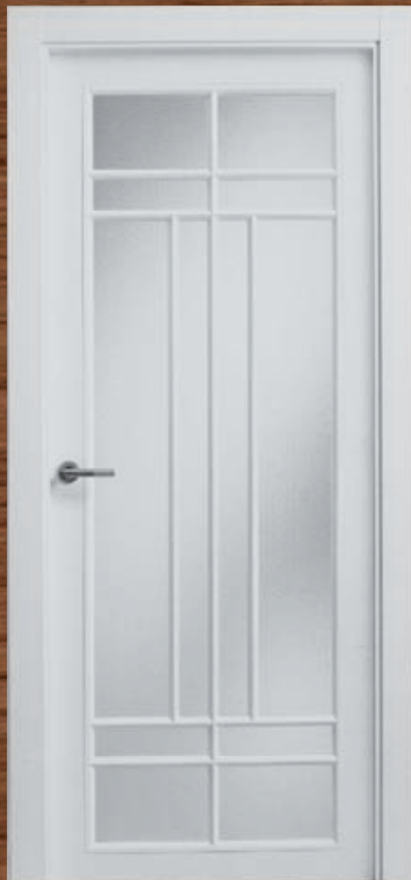
LAC 231 V