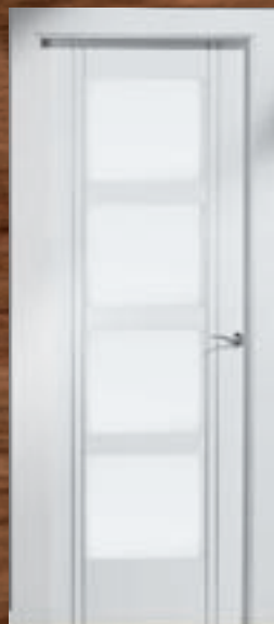
LAC 245 4V