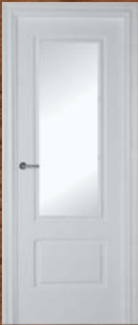
LAC 202 IV