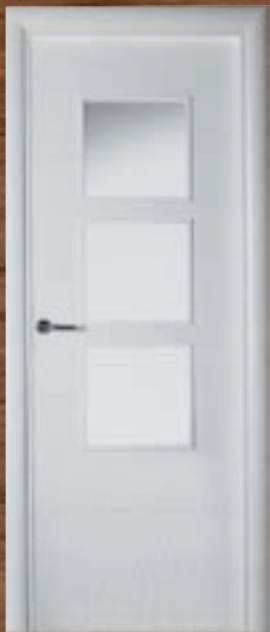
LAC 220 3UV