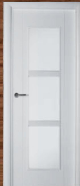
LAC 217 3UV