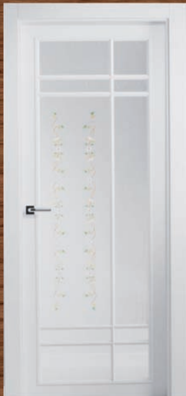
LAC 229 V