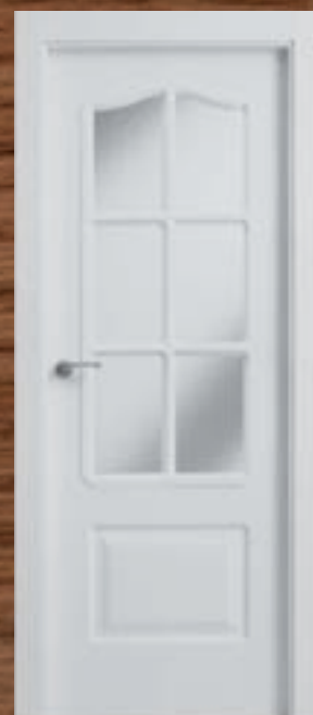
LAC 203 6V