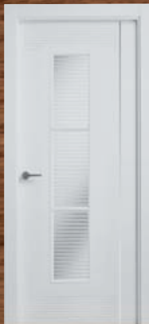
LAC 226 3V