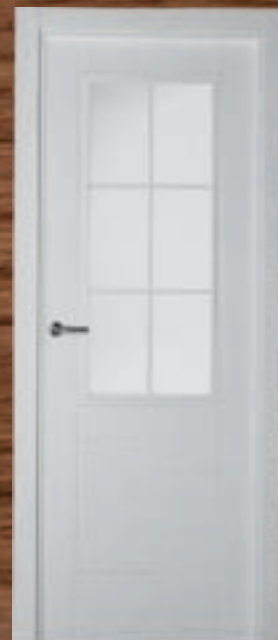
LAC 219 6V