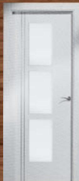
LAC 244 3VC