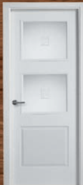
LAC 240 2V