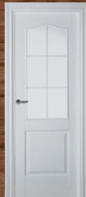
LAC 212 6V