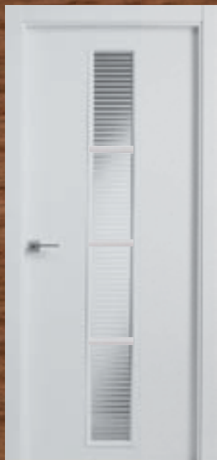
LAC 227 4V