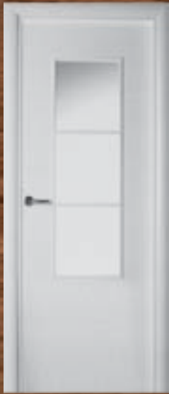
LAC 220 3V