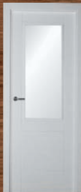
LAC 219 V