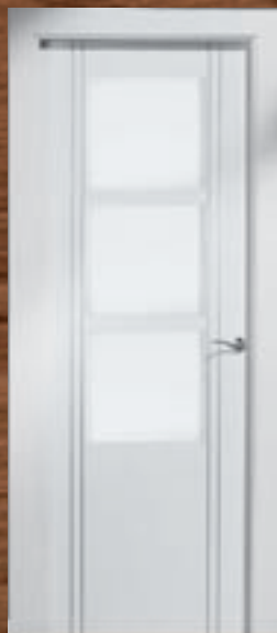
LAC 245 3V