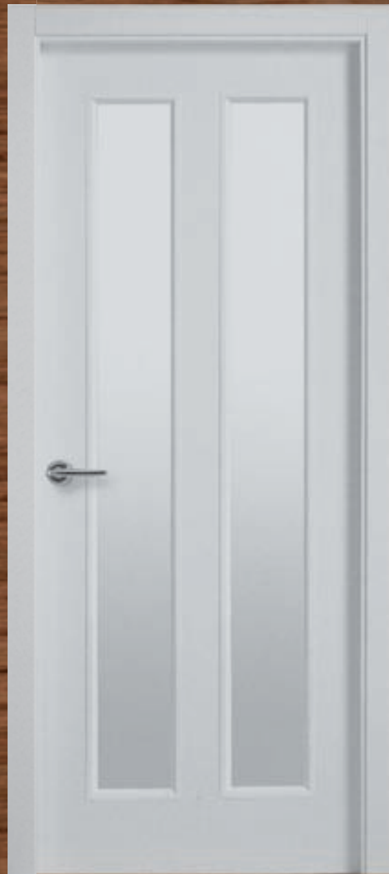
LAC 239 V