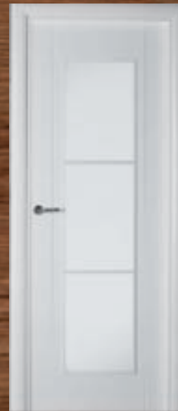
LAC 217 3V