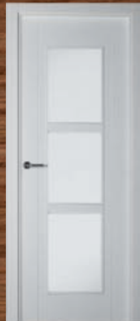
LAC 218 3UV