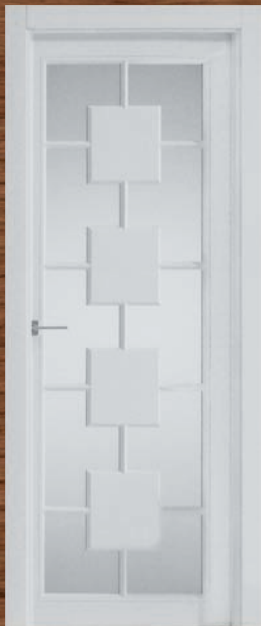
LAC 233 V