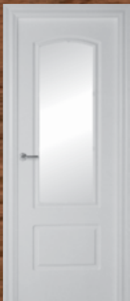
LAC 204 V