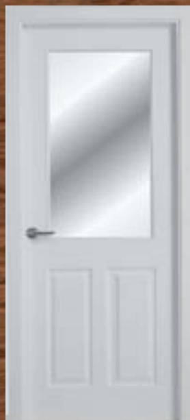
LAC 208 V