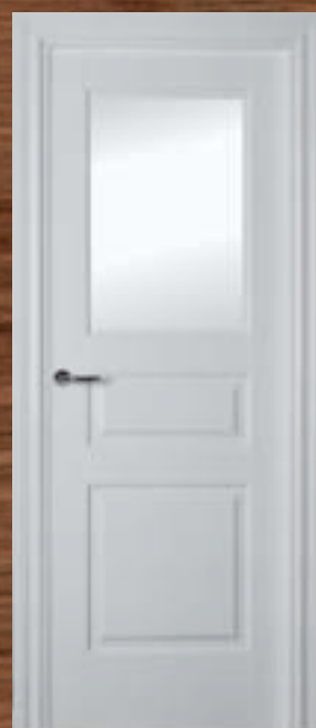
LAC 210 IV