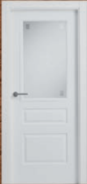
LAC 206 V