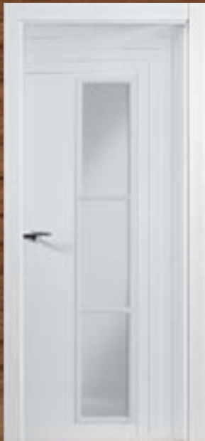
LAC 223 3V