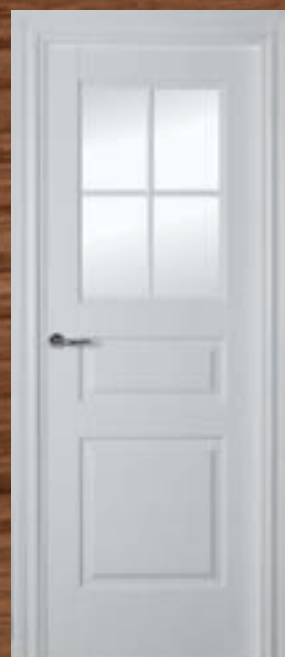
LAC 210 4V