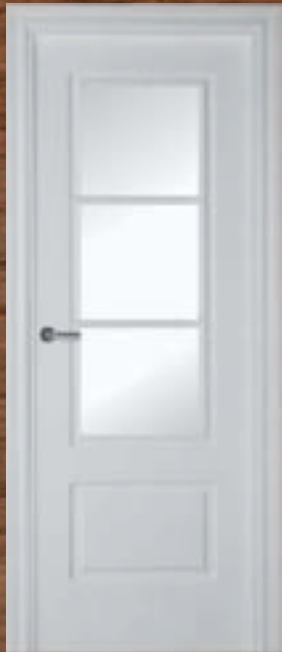
LAC 202 3V