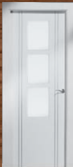
LAC 245 3VC