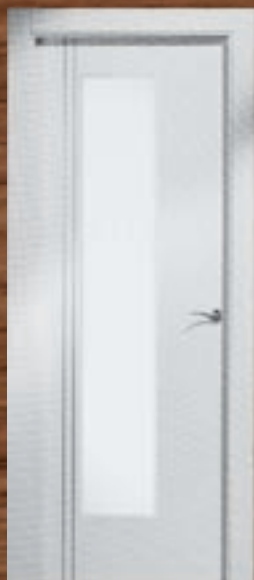
LAC 244 VC