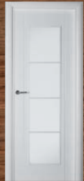
LAC 217 4V