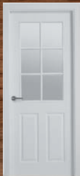
LAC 208 6V