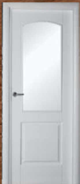
LAC 213 V