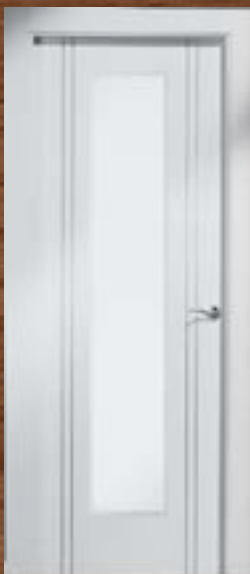
LAC 245 VC