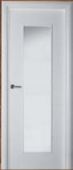
LAC 220 V