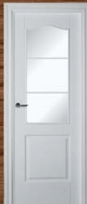
LAC 212 3V