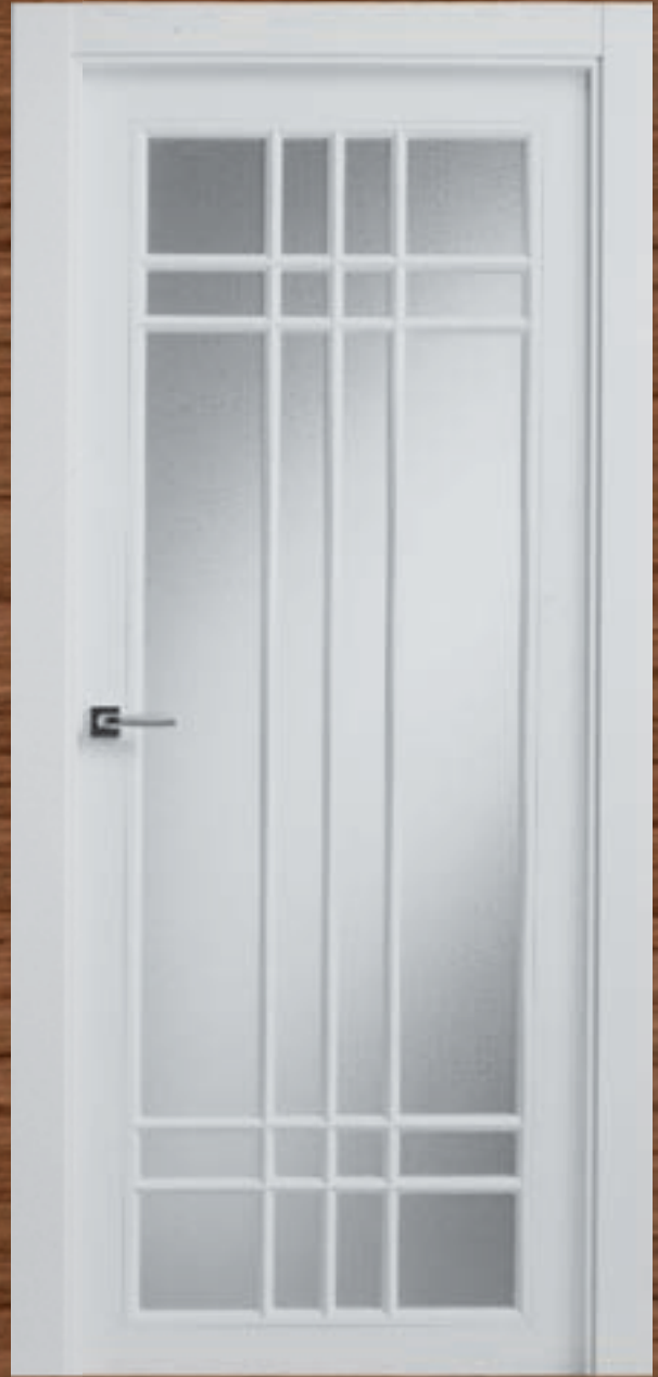
LAC 230 V