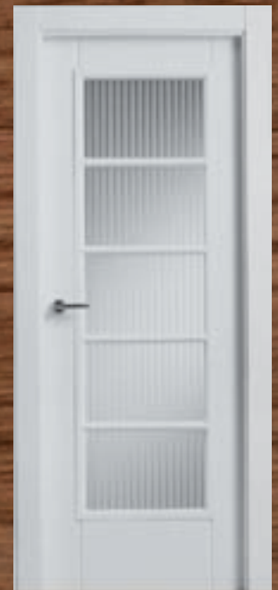
LAC 221 5V