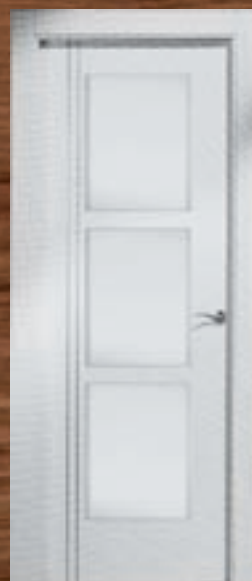
LAC 244 3V