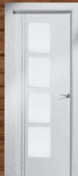
LAC 244 4VC