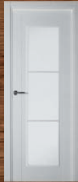
LAC 218 3V