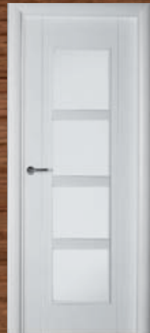
LAC 217 4UV