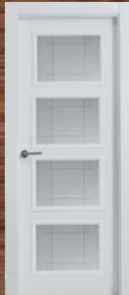
LAC 207 4V