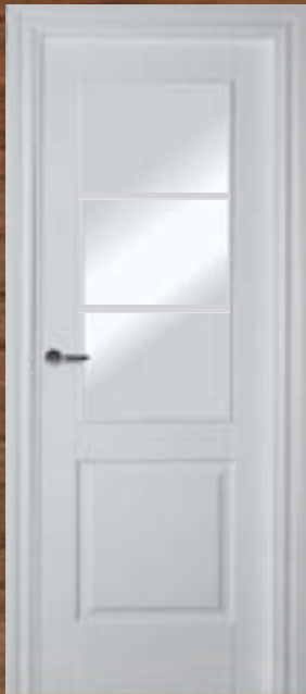
LAC 211 3V