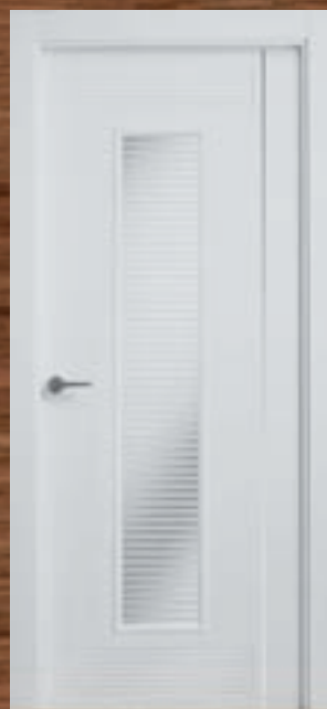
LAC 226 V