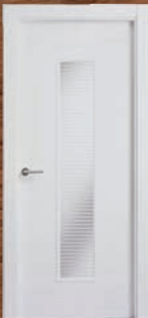
LAC 225 V