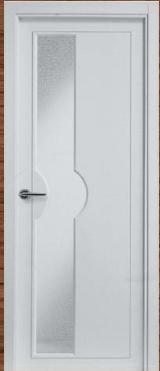
LAC 243 V