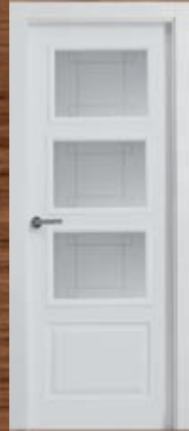
LAC 207 3V