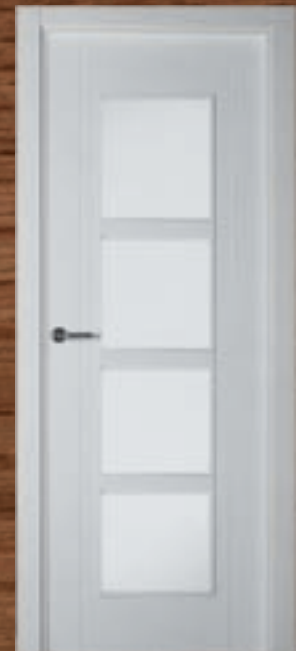
LAC 218 4UV