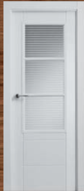
LAC 221 3V