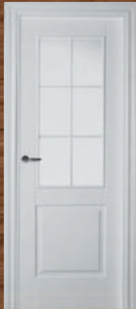
LAC 211 6V