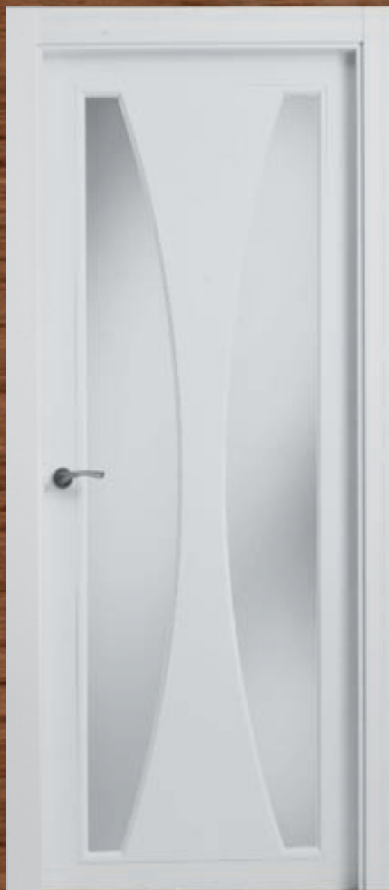
LAC 234 V