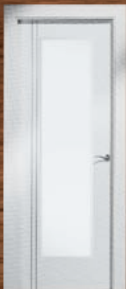
LAC 244 V