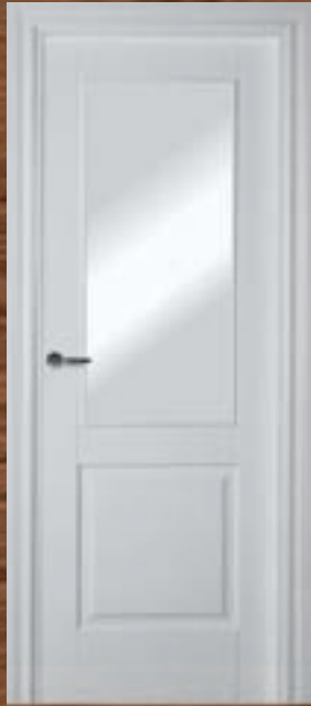
LAC 211 V