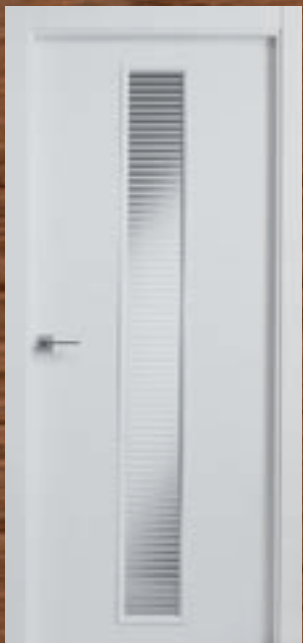
LAC 227 V