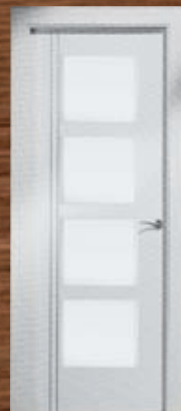
LAC 244 4V