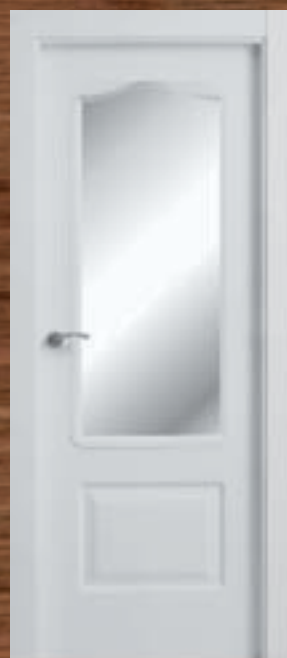
LAC 203 V