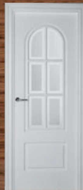
LAC 205 6V