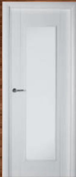
LAC 217 V