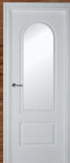
LAC 205 V