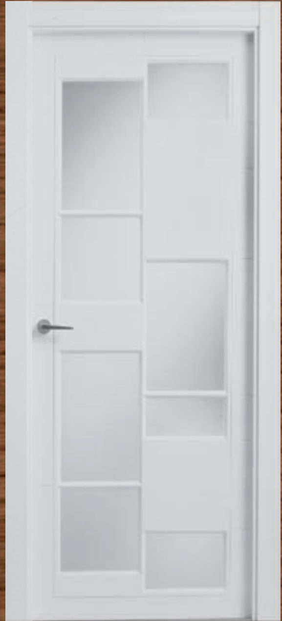
LAC 232 V