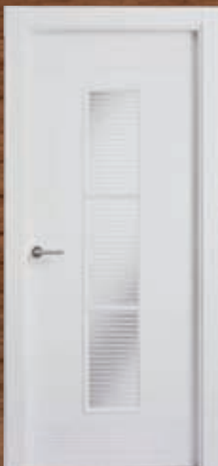
LAC 225 3V