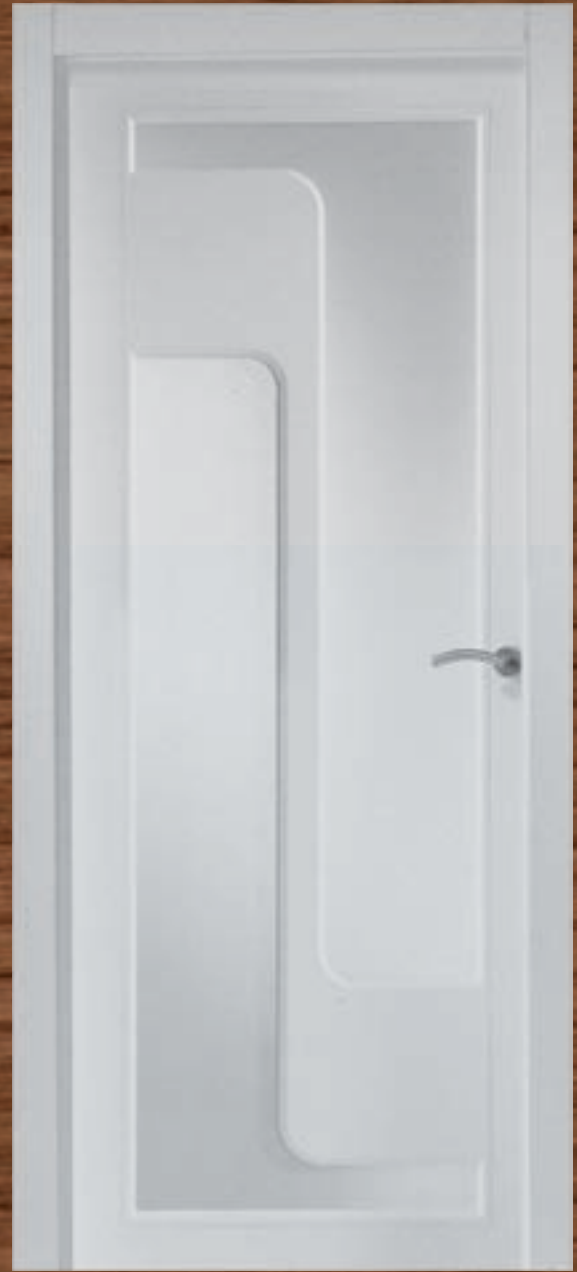
LAC 237 V