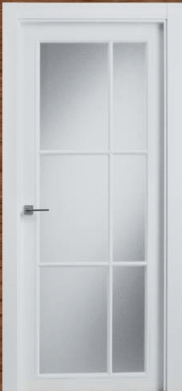
LAC 228 V