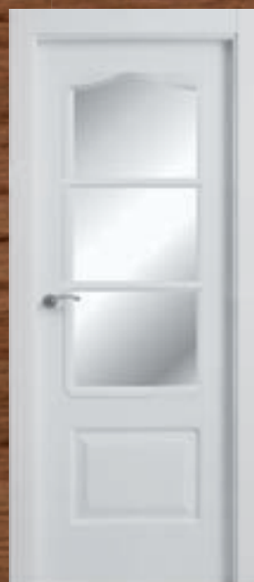
LAC 203 3V