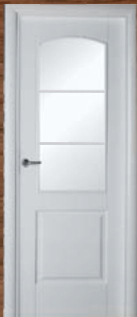
LAC 213 3V