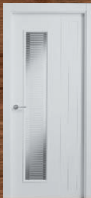
LAC 224 V