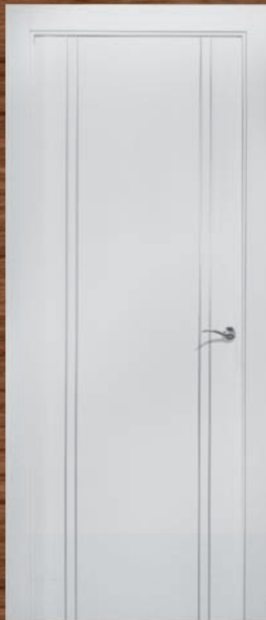
LAC 245 Perfil Aluminio