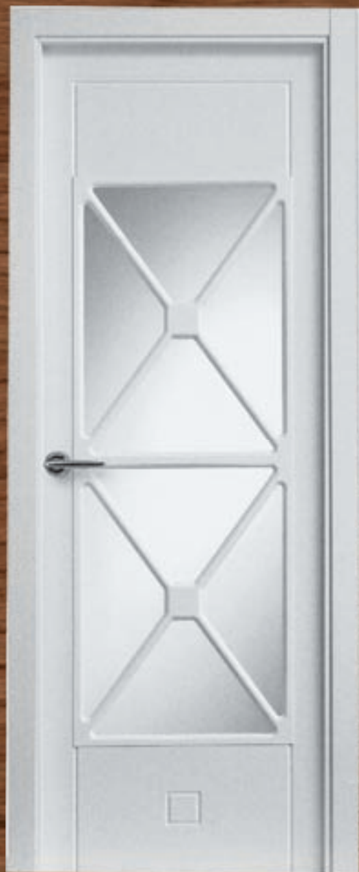
LAC 242 V