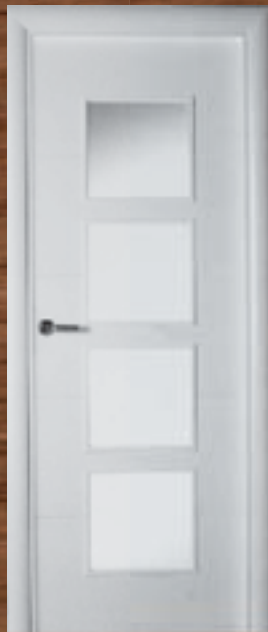
LAC 220 4UV