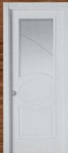
LAC 214 V