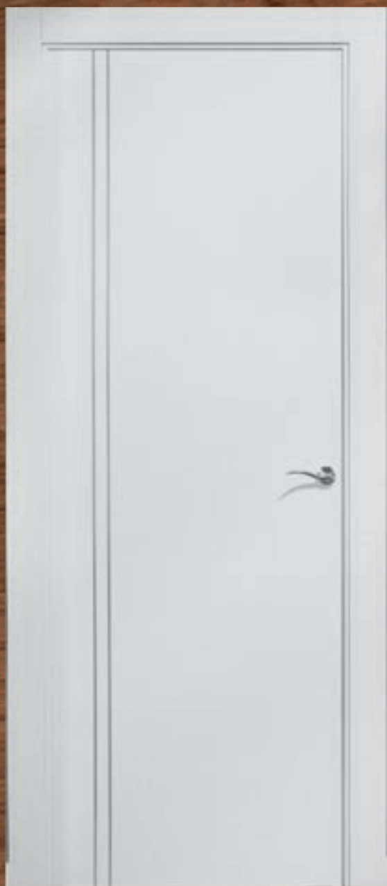
LAC 244 Perfil Aluminio